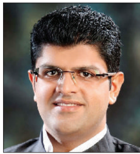
उचाना। डिप्टी सीएम दुयंत चौटाला।

नए साल के आगज होते ही सभी नेताओं ने अपना जनसंपर्क अभियान तेज कर दिया है। कड़ाके की ठंड के बीच शुक्रवार को राजनीति का तड़का लगेगा। दोपहर बाद घोघड़िया गांव में स्थनीय विधायक एवं डिप्टी सीएम दुयंत चौटाला पहुंचेंगे। यहां पर 30 से अधिक जगहों पर कार्यक्रमों के यहां चाय पीएंगे तो विभिन्न सामाजिक कार्यक्रमों में भी वो पहुंचेंगे। डिप्टी सीएम के कार्यक्रम को लेकर जेजेपी नेताओं,