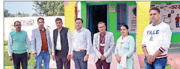
नरवाना। स्कूल स्टाफ सदस्य।