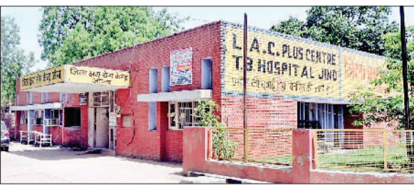
जीद। नागरिक अस्पताल स्थित जिला क्षय रोग केंद्र।

स्वास्थ्य विभाग द्वारा क्षय रोग (टीबी) को जड़मूल से समाप्त करने के लिए बीसीजी टीकाकरण अभियान शुरू किया है। अभियान से पहले स्वास्थ्य विभाग द्वारा एक विशेष तरीके का सर्वे किया जाएगा। जिसके तहत 18 वर्ष से ऊपर के लोगों की पहचान की जाएगी जो धुम्रपान करते हैं या पांच साल पहले क्षय रोग बीमारी से ग्रस्त हुए थे। या फिर परिवार में तीन साल पहले किसी को ये बीमारी थी। ऐसे लोगों का आंकड़ा एकत्रित किया जाएगा और फिर उनकी अनुमति लेकर