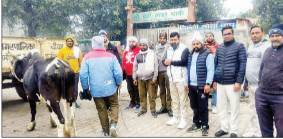
गुहला-चीका। बेसहारा गायों व आवारा पशुओं को पकड़ते हुए नपा कर्मचारी।

नगरपालिका चीका ने सड़कों पर घूम रहे बेसहारा व आवारा पशुओं को पकड़ने के लिए आज फिर एक विशेष अभियान चलाया। मालूम रहे कि नपा ने चार दिन पहले भी कुछ पशुओं को पकड़ा था। नगरपालिका कर्मचारियों के पशु पकड़ो अभियान में शहर के कई समाजसेवी संस्थाओं से जुड़े हुए लोग भी साथ दे रहे हैं। जानकारी के अनुसार पिछले कुछ समय से लोग यह शिकायत कर रहे थे कि जहां कड़कड़ाती ठंड में रात को गौवंश खुले में रहने के कारण ठिठुरा रहता है और एक-एक करके दम तोड़ रहा है, वहीं धुंध व कोहरे के चलते रात को दुर्घटनाएं भी बढ़ रही थी, जिसमें पशु भी चोटिल हो रहे थे और लोग