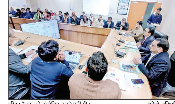
जींद। बैठक को संबोधित करते एडीसी।

लिंगानुपात संतुलन को लेकर आपसी तालमेल के साथ कार्य करते हुए सहयोग दें। जिला के जिन क्षेत्रों में लिंगानुपात कम है उन क्षेत्रों में विशेष अभियान चला कर आमजन को जागरूक किया जाए। इसके अलावा आंगनबाड़ी केंद्रों व ग्राम पंचायतों में विभिन्न कार्यक्रमों के माध्यम से जागरूक करने के साथ-साथ लोगों को बेटियों की शिक्षा के लिए प्रेरित भी करें। उन्होंने कहा कि पीसीपीएनडीटी अधिनियम का जिला में पालन करने के लिए स्वास्थ्य विभाग के साथ-साथ जिला प्रशासन तत्पर है। जिला में जितने भी अल्ट्रासाउंड केंद्र संचालक हैं, उन्हें पीएनडीटी अधिनियम के तहत जुड़े नियमों का पालन करना चाहिए। उन्होंने बताया कि ऐसे अल्ट्रासाउंड सेंटर जो पीएनडीटी एक्ट का उल्लंघन कर