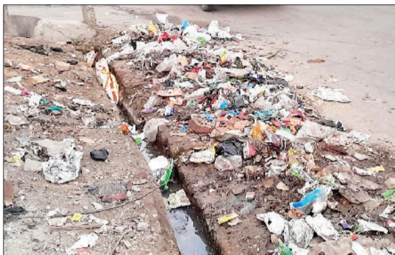
जींद। शहर में दिखाई देती गंदगी।

जींद शहर स्वच्छता के मामलों में पिछड़ा जा रहा है। साल भर में स्वच्छता पर नप करोड़ों रुपये खर्च करती है जबकि साफ-सफाई पर हर माह नगर परिषद एक करोड़ से भी ज्यादा भुगतान नगर परिषद करती है। बावजूद इसके जींद देश के तीनों सौ शहरों में भी स्वच्छता के मामले में स्थान नहीं बना पाया है। कभी प्रदेश की नगर परिषदों में अक्ल रहने वाला जींद अपनी रैंकिंग में लगातार गिरता जा रहा है। वर्ष 2023 में हुए स्वच्छता सर्वेक्षण में जींद शहर इस बार प्रदेश में 17वें स्थान पर पहुंच गया है। देश स्तर पर बात की जाए तो फिसल कर के 312वें पायदान आ पहुंचा है। यह गिरावट देश की रैंकिंग में 89 अंक है। 2022 में देश की स्वच्छता रैंकिंग में जींद 223वें पायदान पर था। जबकि प्रदेश में 16वें स्थान पर था। देश में स्वच्छता से सन 2016 में शुरू किया गया था ताकि शहरी इलाकों में स्वच्छता को बढ़ावा मिले। शुरू आती दौर में इस कार्य अच्छा हुआ बाद में उसी दर