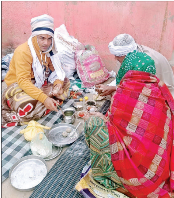
जीद। पौष अमावस्या पर पिंडारा तीर्थ पर पिंडदान करवाते श्रद्धालु।

पांडु पिंडारा स्थित पिंडतारक तीर्थ पर वीरवार को पौष अमावस्या पर श्रद्धालुओं ने ठंड के बीच सरोवर में स्नान किया तथा पिंडदान करके करके तर्पण किया। ऐतिहासिक पिंडतारक तीर्थ पर बुधवार को शाम से ही श्रद्धालुओं का पहुंचना शुरू हो गया था और पूरी रात धर्मशालाओं में सत्संग चला कीर्तन आदि का आयोजन चलता रहा। वीरवार को तड़के से ही श्रद्धालुओं ने सरोवर में स्नान तथा पिंडदान शुरू कर दिया जो मध्याह्न के बाद तक चलता रहा। इस मौके पर दूर दराज से आए श्रद्धालुओं ने अपने पितरों की आत्मा की शांति के लिए पिंडदान किया तथा सूर्य देव को