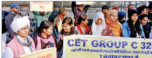
जीद। सीईटी और ग्रुप डी की भर्ती पूरा करने के लिए एकत्रित हुए युवा।

आगामी लोकसभा चुनवों से पहले ग्रुप सी और डी की भर्ती पूरी करने, नोकियों की मांग को लेकर प्रदेशभर से बेरोजगार युवा वीरवार को जाट धर्मशाला में एकत्रित हुए। यहां से युवाओं ने प्रदर्शन शुरू किया और डीसी कार्यालय पहुंच डीसी को मांगों से संबंधित ज्ञापन सौपा। किसान संगठन और दूसरे जनसंगठनों ने भी इन बेरोजगार युवाओं को समर्थन दिया और इनके सहयोग को लेकर साथ रहे। प्रदर्शन का नेतृत्व कर रहे युवाओं ने कहा कि अगर सरकार ने उनकी मांगों पर