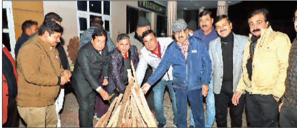
कैथल। इंग्लिस क्लब के पदाधिकारी लोहड़ी उत्सव मनाते।

प्रतिशत तथा हवा की गति छह किलोमीटर दर्ज की गई। मौसम विभाग के अनुसार आगे मौसम शुष्क तथा परिवर्तनशील रहने वाला है। बादलवाह भी आकाश में देखने को मिलेगी। लगभग पखवाड़े के बाद वीरवार को अच्छी धूप खिली। जिसने लोगों को काफी राहत देने का कार्य किया। हालांकि बुधवार को धूप निकली थी लेकिन सुर्य तथा बादलों के बीच अटखेलियों का दौर चलता रहा। वीरवार को दिन का आगाज आंशिक धुंध तथा ठंड के साथ हुआ। दिन चढ़ने के साथ मौसम साफ हो गया और दोपहर को धूप खिल उठी, लोगों को धूप का आनंद लेते देखा गया। सड़कों तथा बाजार में रौनक देखने को मिली। ठंड से ठप पड़ी दिनचर्या भी पटरी पर दिखाई दी। लगभग एक पखवाड़े तक धुंध, कोहरा तथा बादलवाह रहने और कड़ाके की ठंड से फसलों पर विपरीत प्रभाव पड़ रहा था। सरसों में सफेद रत्ना के लक्षण दिखाई देने लगे थे। गेहूं में भी पीलेपन का खरारा मंडराने लगा था।