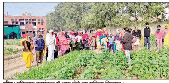
जींद। प्रशिक्षण कार्यक्रम में भाग लेते हुए महिला किसान।

हरियाणा कृषि प्रबंधन एवं विस्तार प्रशिक्षण संस्थान हमेटी में वीरवार को महिला किसानों का प्राकृतिक खेती पर तीन दिवसीय प्रशिक्षण संपन्न हुआ। प्रशिक्षण में महिला किसानों ने गाय के गोबर व गोमूत्र की मदद से जीवाणु खाद का नीमएआरए धूप आदि से जैविक कीटनाशक बनाने सीखा। हमेटी में प्राकृतिक खेती के प्रशिक्षक डा.