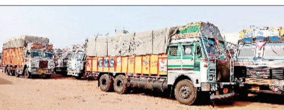
जींद। 19 हड़ताल के चलते खड़े ट्रक।

हिंट एंड न संशोधन बिल वापस लेने के विरोध में एक बार फिर से ट्रक चालकों ने आंदोलन की राह पकड़ी है। कानून वापस लिए जाने तक हड़ताल का ऐलान चालकों द्वारा किया गया है। जींद ट्रक यूनियन का दावा है कि हड़ताल के चलते ही जिले के 500 से 'यादा ट्रकों के पहिए फिर से थम गए हैं। ट्रकों की हड़ताल का असर फिर से सामान दुलाई पर पड़ने की आशंका से इंकार नहीं किया जा सकता।