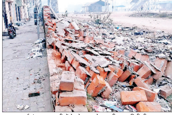
उचाना। वार्ड नंबर सात गली में रेलवे माल गोदाम की तरफ गिरी दीवार।

शहर के वार्ड नंबर सात में नपा के पुराने ऑफिस के सामने वाली गली के साथ लगती रेलवे की दीवार जर्जर होकर गिरने लगी है। यहां कई साल पहले अपने आप कई जगहों से दीवार गिर चुकी है तो कई महीनों से दीवार में आई दरार के बाद गुरुवार रात दीवार गिर गई। शुरु है कि दीवार रेलवे मालगोदाम की तरफ गिरी गली की तरफ दीवार गिरती तो कोई हादसा हो सकता था। दीवार के साथ महिलाएं बैठ जाती हैं तो बच्चे भी गली में खेलते रहते हैं। कई बार दीवार का नए सिरे से निर्माण की मांग कर चुके हैं लेकिन कोई समाधान नहीं हो रहा है। जर्जर हो चुकी दीवार के गिरने के चलते