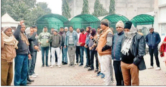
कैथल। कर्मचारियों को न्योता देते पदाधिकारी।

कर्मचारियों की लम्बित मांगों को लेकर व सरकार की जनविरोधी नीतियों के खिलाफ सर्व कर्मचारी संघ हरियाणा 4 फरवरी को रोहतक में जोरदार रैली करेगा। इसकी तैयारियों को लेकर पब्लिक हेल्थ, आईटीआई, मार्केट कमेटी, खाद्य आपूर्ति विभाग, वेयर हाउस, हैफेड व पशुपालन विभाग में टीमें चलाकर कर्मचारियों से संपर्क साधा गया और